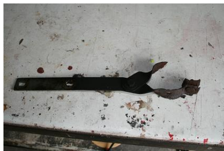
alter Halter ausgebaut