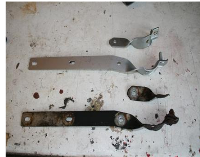
alter und neuer Halter

Da ich weder Bühne noch Grube besitze musste ich den Z vorne rechts aufbocken, sicherte das Fahrzeug mit einem Unterstellbock unter der Querträgeraufnahme ab, damit der Z stabil genug steht stützte ich zusätzlich das gute Stück noch an der hinteren Aufnahme mit einem zweitem Heber ab ( zweiter U-Bock geht aber auch ).