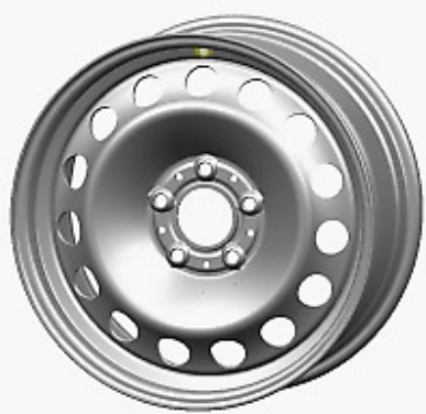
Styling 1, 12