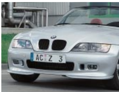
AC Schnitzer Frontflipper, 2-teilig