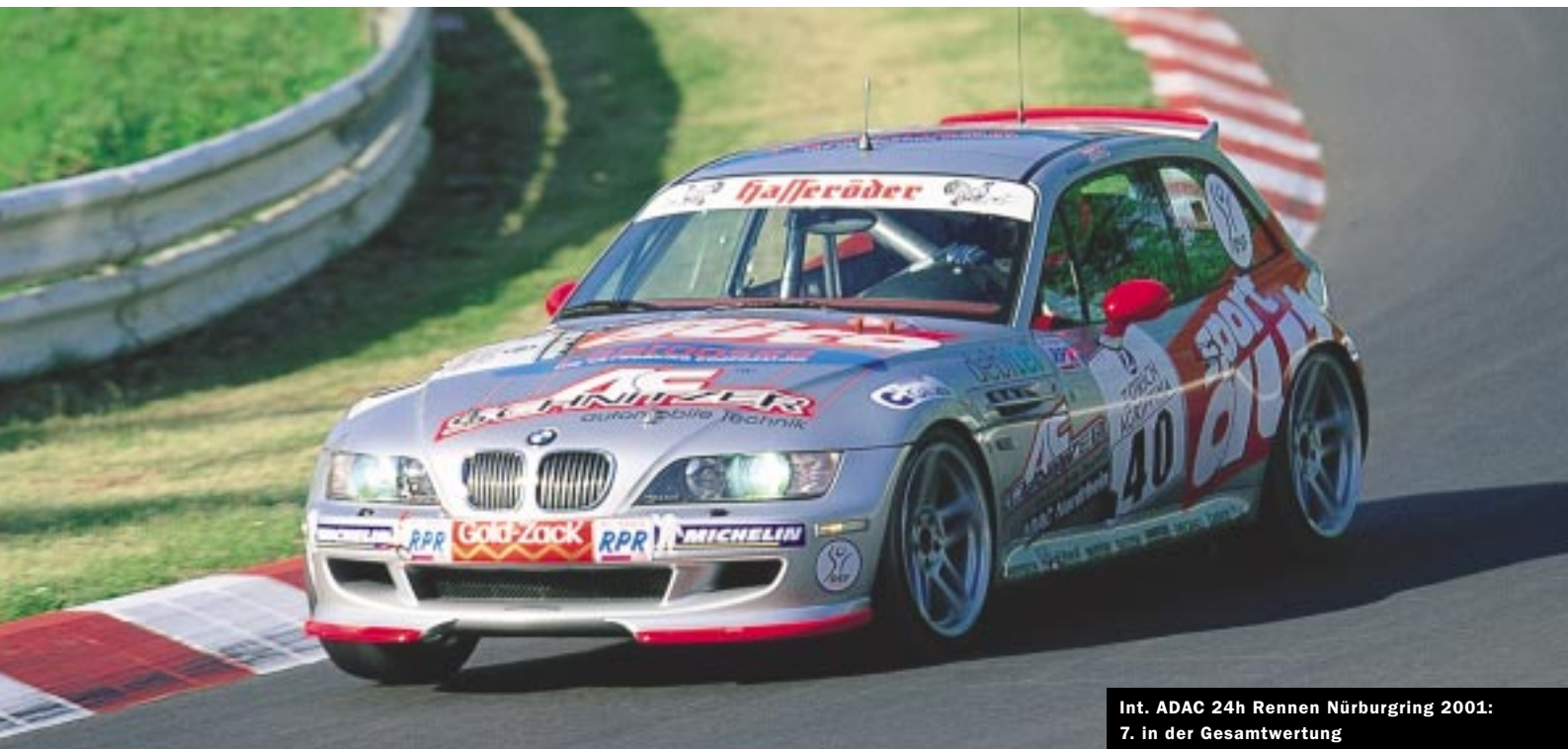
Int. ADAC 24h Rennen Nürburgring 2001: 7. in der Gesamtwertung