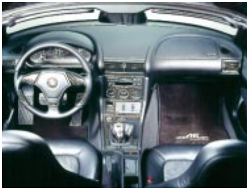
AC Schnitzer Carboninnenausstattung für Fahrzeuge mit Ablagefach oder Schalterleiste