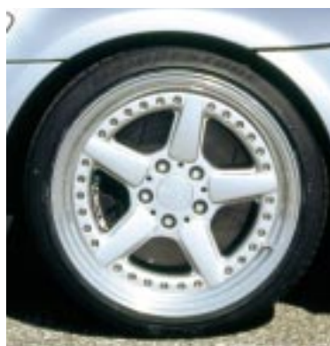
Schon längst ein Klassiker: die AC Schnitzer Leichtmetallfelge als Typ II oder als Typ III (oben) mit variablem Speichendesign.

Ein für alle AC Schnitzer Z3 obligatorisches Ausstattungsmerkmal sind AC Schnitzer Felgen als Typ II oder Typ III. AC Schnitzer Felgen bestehen nicht nur durch ihre hohe Funktionalität, immerhin ist die AC Schnitzer Felge Typ III rund 30% leichter als eine konventionelle Leichtmetallfelge, sondern auch durch ihren hohen ästhetischen Reiz. Schon mehrfach für ihr Design ausgezeichnet, handelt es sich beim AC Schnitzer Rad und seinen beiden Nachfolgern inzwischen um Klassiker.