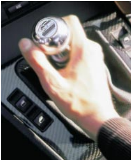
AC Schnitzer Aluminium Schaltknopf