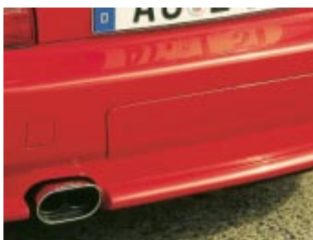
AC Schnitzer Heckschürzendesignelement für das Z3 coupé in Kombination mit dem AC Schnitzer Endschalldämpfer