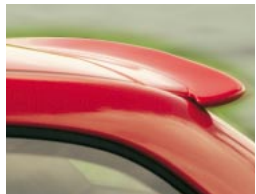
Aerodynamik der dezenten Art: der AC Schnitzer Dachheckspoiler für das Z3 coupé und für das M coupé.

Mit den AC Schnitzer Aerodynamikkomponenten fasziniert das Z3 coupé durch konsequent sportliches Karosseriedesign. Für die entsprechende Leistung bürgt der 3,2-Liter-Motorumbau.