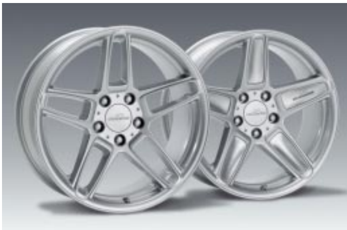
AC Schnitzer Leichtmetallfelgen Typ III, silber (Bild oben), in den Größen 8,5J x 17", 8,5J x 18", 9,5J x 18", 8,5J x 19" und 9,5J x 19", optional mit individuell lackierbaren Designelementen;