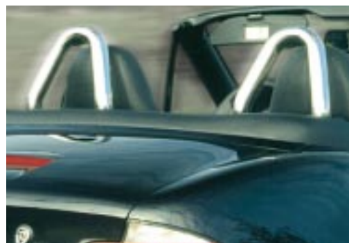
AC Schnitzer Überrollbügel aus handpoliertem V2A Edelstahl für alle Z3 roadster mit werkseitigen Überrollbügeln