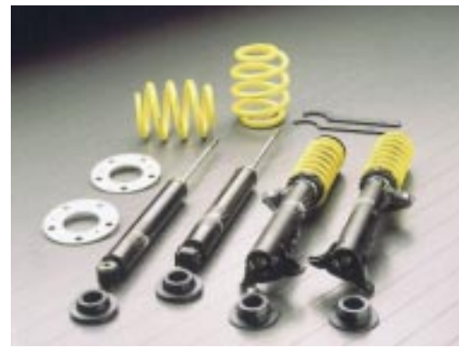
AC Schnitzer Rennsportfahrwerk inklusive Tieferlegung in sportlich straffer Abstimmung für BMW Z3 2.8, M coupé und M roadster