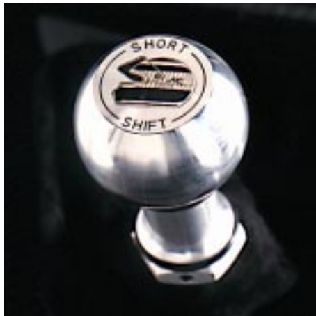
AC Schnitzer „Short Shift“ Sportschaltung – verkürzte Schaltwege wie in einem Renntourenwagen