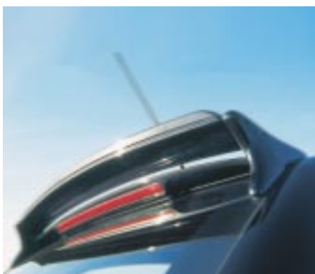
Aerodynamik im Renn-Look: der AC Schnitzer Heckflügel sorgt für mächtigen Abtrieb an der Hinterachse des M coupé.