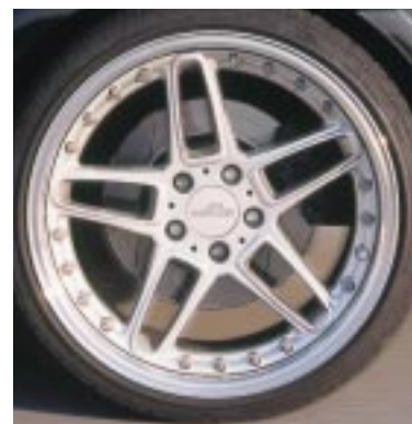
Der Designklassiker in der dritten Generation: die AC Schnitzer Leichtmetallfelge Typ III, hier mit offenen Speichen.