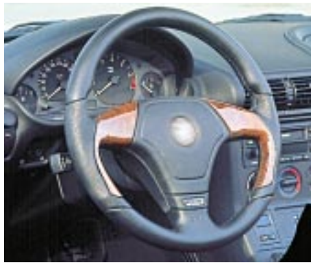
AC Schnitzer 3-Speichen-Sport-Airbaglenkrad, in Leder, wahlweise mit Carbon oder Walnußholz