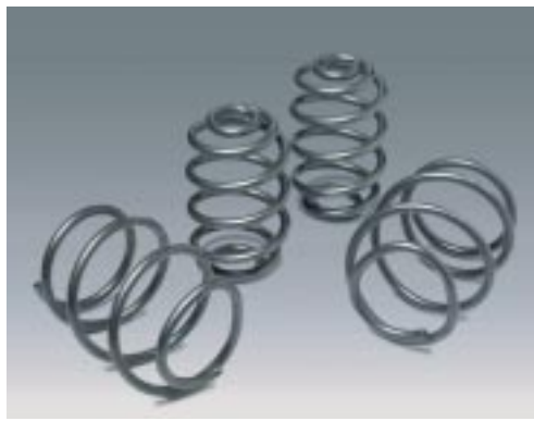
AC Schnitzer Fahrwerksfedernsatz für Fahrzeuge mit und ohne M-Technik Stoßdämpfer für BMW Z3 1.8 - 2.8