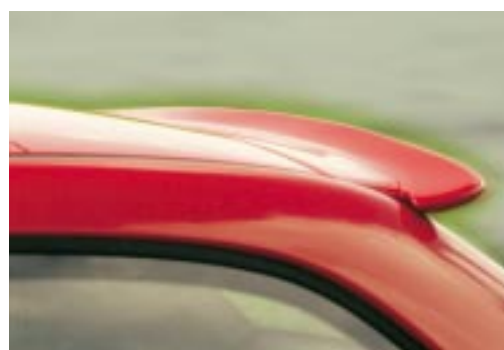
AC Schnitzer Dachheckspoiler für das Z3 coupé