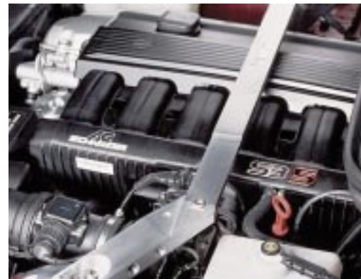
AC Schnitzer Saugrohrbausatz Z3 S für BMW Z3 2.8 mit M52 Motor, Mehrleistung 18 kW (25 PS) AC Schnitzer Aluminium-Federbeinbrücke für Z3 Modelle in Vorbereitung