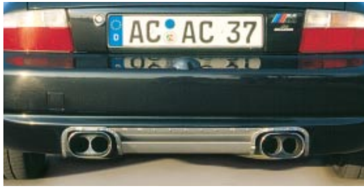
Da steckt Musik drin: AC Schnitzer V-max-Modul zur Aufhebung der serienmäßigen Vmax-Abregelung inkl. Sportnachschalldämpfer aus V2A-Edelstahl für Mroadster und M coupé AC Schnitzer Heckdiffusor für Mroadster und M coupé (optional)