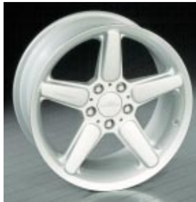
AC Schnitzer Leichtmetallfelgen Typ II, silber, in den Größen 7,0J x 15", 8,0J x 17" und 8,5J x 18"