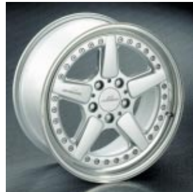
AC Schnitzer Rennsportfelgen Typ II, silber mit poliertem Außenbett in den Größen 8,0J x 17", 9,0J x 17", 8,5J x 18", 9,0J x 18" oder 9,5J x 18"