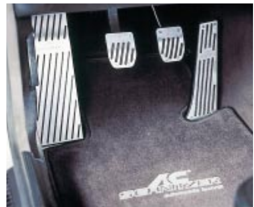
AC Schnitzer Aluminium-Pedalerie und -Fußstütze und AC Schnitzer Hochvelour-Fußmatten