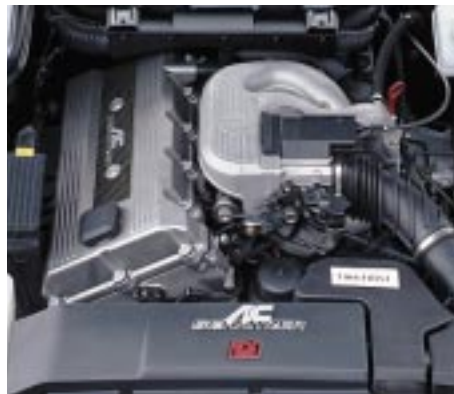
AC Schnitzer Triebwerk Z3 2.1 für BMW Z3 1.8 mit M43 Motor, Leistung: 108 kW (147 PS) AC Schnitzer Triebwerk Z3 2.1 für BMW Z3 1.9 mit M44 Motor, Leistung 129 kW (175 PS)