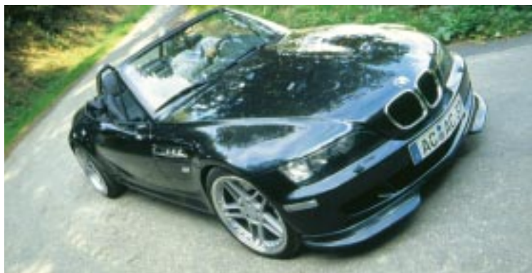
Die AC Schnitzer Frontschürze mit integrierten Nebelscheinwerfern und vergrößerten Lufteinlaßschlitzen gewährleistet optimale aerodynamische Werte