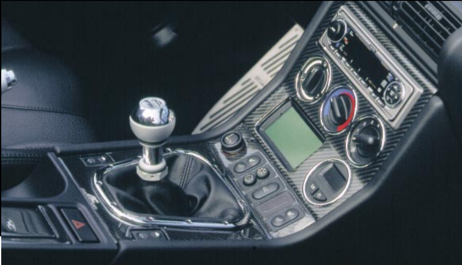
Bedienungsfreundliches Technologiezentrum: Die AC Schnitzer Carbon Mittelkonsole im Z3 mit AC Schnitzer audio concept inklusive VDO dayton Navigationssystem MS 3000 – Individuallösung auf Anfrage