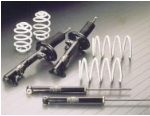
AC Schnitzer Sportfahrwerk inklusive Tieferlegung in sportlich komfortabler Abstimmung