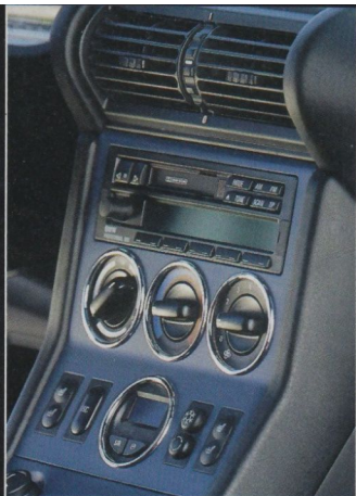
■ Die Mittelkonsole zeigt sich gut aufgeräumt, kein Überfluss