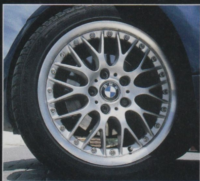
■ Gegen Aufpreis rollte das Coupé auf 17-Zoll-Rädern im Kreuzspeichendesign

Wer es beispielsweise wagte, den Innenraum des Coupés als „zu eng!!!“ zu kritisieren, wurde mit einem ebenso knap-