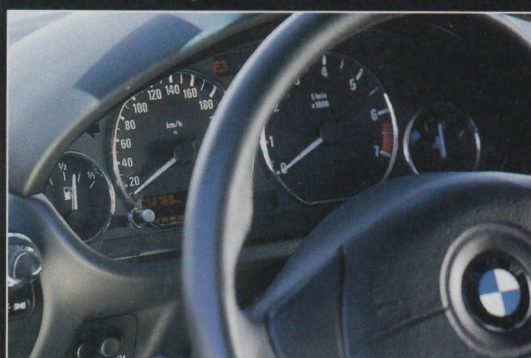
■ Das Lederlenkrad lässt sich leider nicht justieren. Die Instrumente sind klar skaliert und sehr gut ablesbar