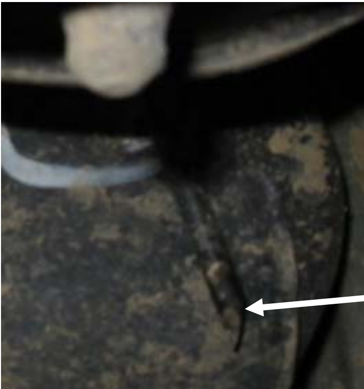
Abflussschlauch unter dem Boden am Tank.