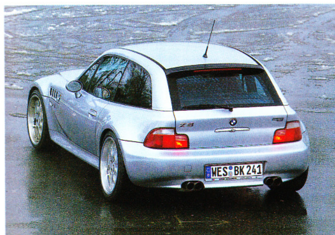
ZWEIFEL ERLAUBT Ist das BMW Z coupé nicht vielleicht doch schöner als der Audi TT?

Oder doch nur ein fauler Kompromiß? Optisch geht Kelleners wie gewohnt eher dezent ans Werk. Die Frontschürze stammt ebenso wie die weißen Blinker und die Außenspiegel vom M coupé, und die Heckschürze muß für die Doppelauspuff-