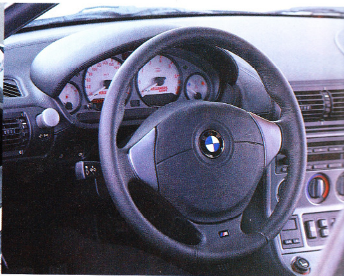
OHNE SCHNÖRKEL Die in Silber und Rot gehaltene Tachofolie paßt bestens zum übrigen sportlichen Inter

stimmung des Fahrwerks: In Verbindung mit den breiten Bridgestone-Pneus sorgt die straffere Auslegung für eine deutlich verbesserte Straßenlage, ohne dabei konsequent auf Sportlichkeit, sprich Härte, getrimmt zu sein. Nur extreme Längsrillen bringen das bullige Coupé et-