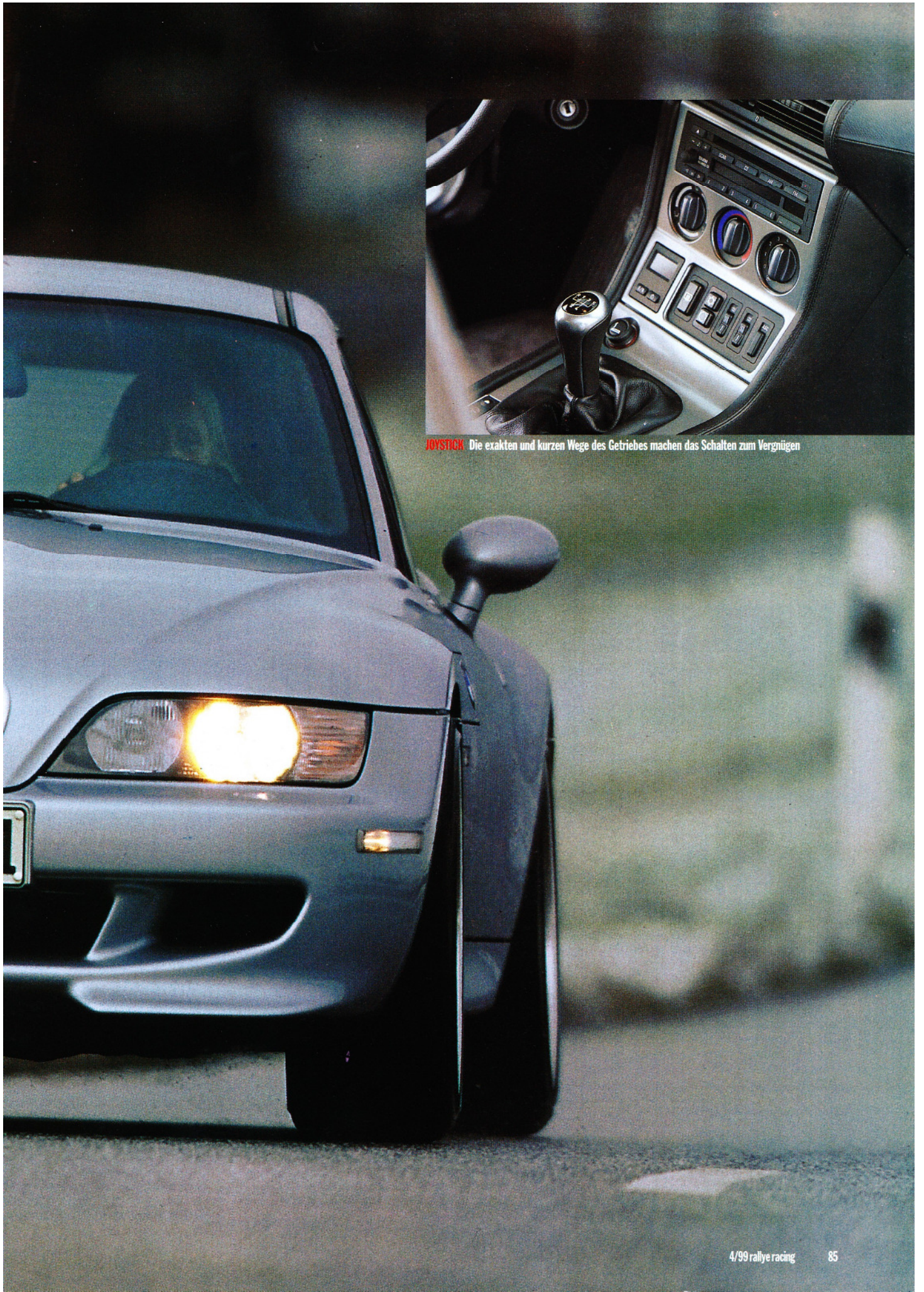
JOYSTICK Die exakten und kurzen Wege des Getriebes machen das Schalten zum Vergnügen