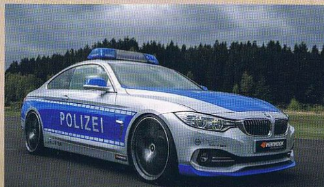
AC SCHNITZER IN UNIFORM